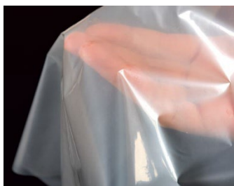
柔軟耐熱フィルム